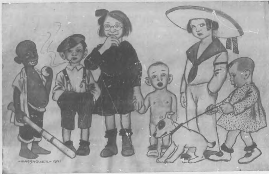
Estudios por el genial Massaquez especial para BOHEMIA.

Lo de la infancia tiene su pro y su contra, como lo tiene todo en este mundo; lo mismo el ser rico que ser poseedor de una figura irresistible, de esas que dejan tras de sí ensartados y sangrando, tiernos corazones.